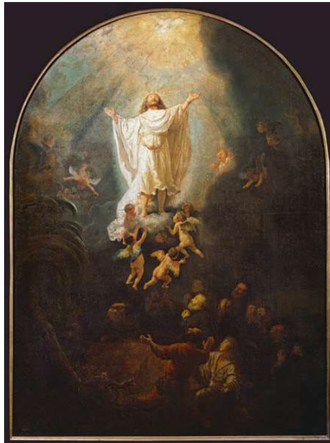
L'Ascension du Christ Rembrandt