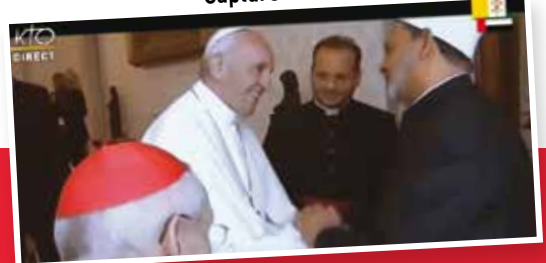
Capture d'écran de la chaîne KTO.

Ce journal a été tiré à 27 200 exemplaires.