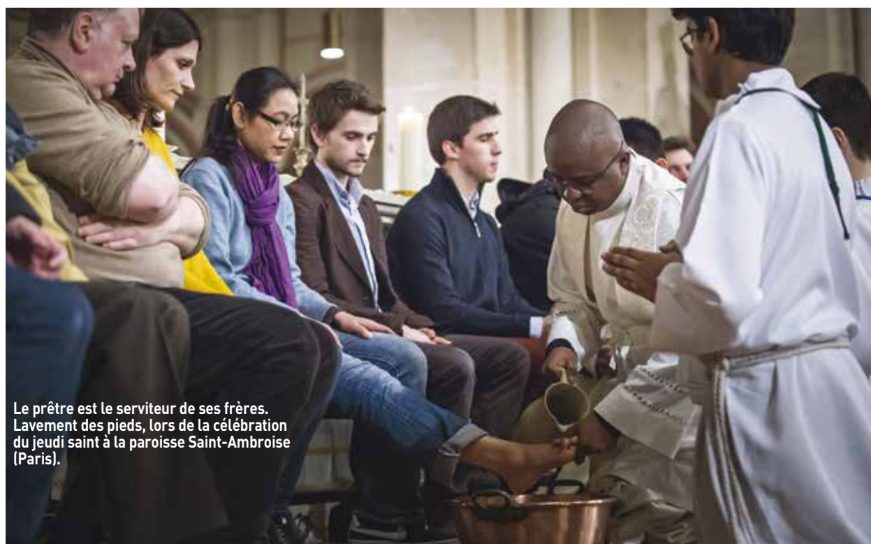
Le prêtre est le serviteur de ses frères. Lavement des pieds, lors de la célébration du jeudi saint à la paroisse Saint-Ambroise (Paris).

1. Déclaration du Conseil économique des Églises intitulée : «Baptême, eucharistie, ministères» (page 82).