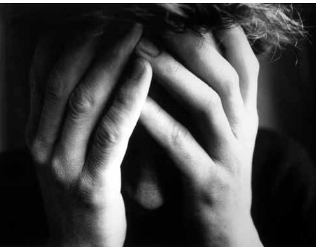
Les blessures infligées par les abus sexuels ne disparaissent jamais.