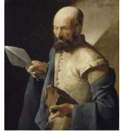
Georges de la Tour

Saint Thomas, l'un des douze apôtres choisis par Jésus, dès les premiers jours de sa vie publique, pour en faire l'un de ses apôtres.