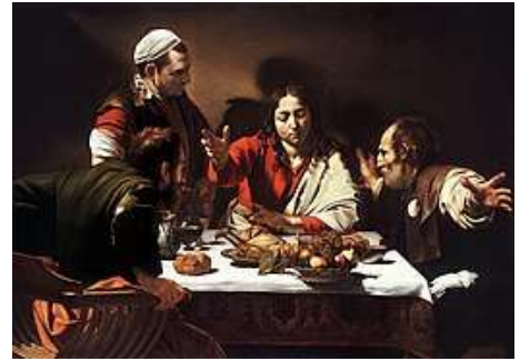
Caravage, Le souper à Emmaüs

Que notre cœur soit brûlant, comme celui des Pèlerins d'Emmaüs, à la lecture des écritures!